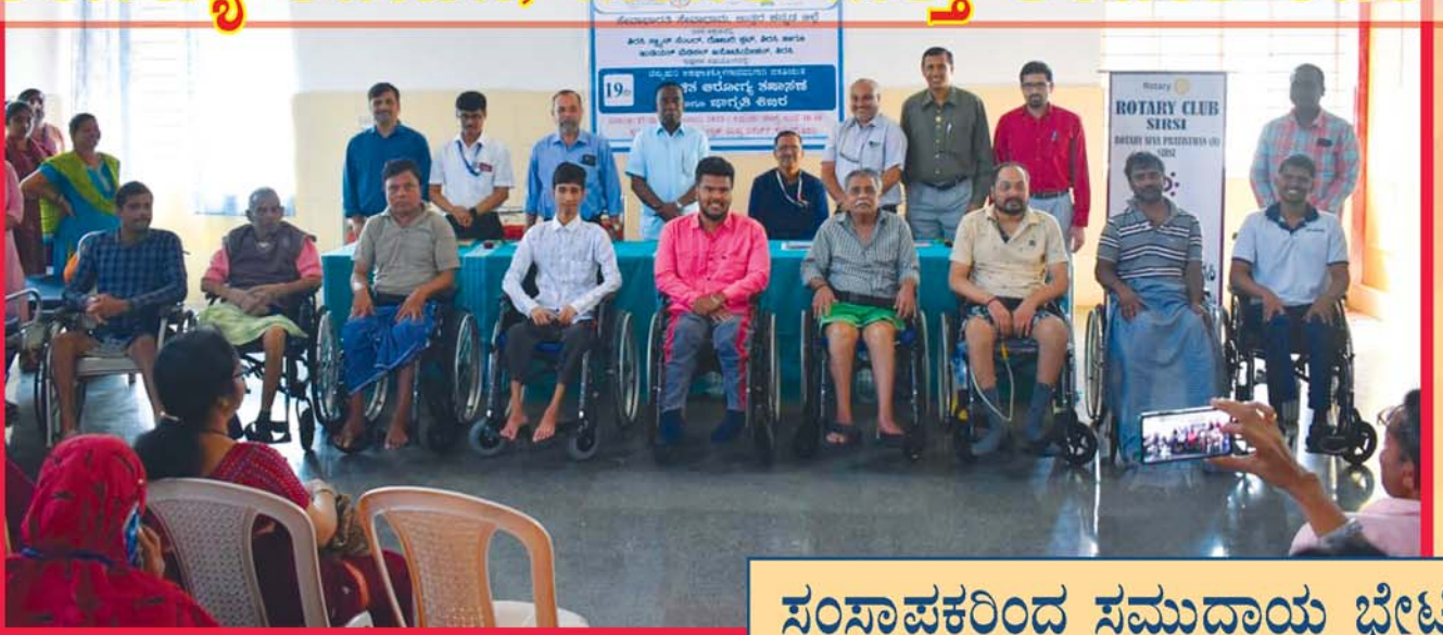
ಸಂಸ್ಥಾಪಕರಿಂದ ಸಮುದಾಯ ಭೇಟಿ

ಉ.ಕ. ಜಿಲ್ಲೆಯ ಸಿರ್ಸಿಯಲ್ಲಿ 19ನೇ ಉಚಿತ 2 ದಿನಗಳ ವಸತಿಯುತ ಆರೋಗ್ಯ ತಪಾಸಣೆ, ಮಾಹಿತಿ ಮತ್ತು ತರಬೇತಿ ಶಿಬಿರ