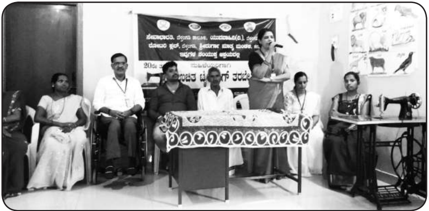
ಉಚಿತ ಟೈಲರಿಂಗ್ ತರಬೇತಿ ಮುಂಡೂರು ಗ್ರಾಮ

ದಿನಾಂಕ 02.10.2019 ರಂದು ಸೇವಾಭಾರತಿಯ ಘಟಕವಾದ ಶ್ರೀದುರ್ಗಾ ಮಾತೃಮಂಡಳಿ ಇವುಗಳ ಸಂಯುಕ್ತ ಆಶ್ರಯದಲ್ಲಿ 22ನೇ ಉಚಿತ ಟೈಲರಿಂಗ್ ತರಬೇತಿ