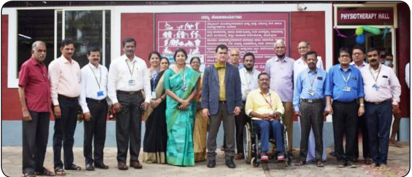
ಸೇವಾ ಹಿ ಪರಮೋ ಧರ್ಮಃ