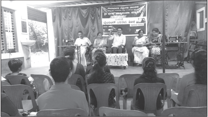
ಸೇವಾನಿಕೇತನದಲ್ಲಿ ನಡೆದ 15ನೇ ಹೊಲಿಗೆ ತರಬೇತಿ ಶಿಬಿರ ಸಮಾರೋಪ ಸಮಾರಂಭ