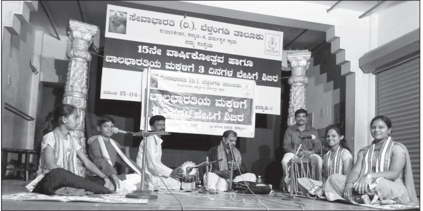
ಬಾಲಭಾರತಿ ಬೇಸಿಗೆ ಶಿಬಿರದಲ್ಲಿ ಯಕ್ಷಭಾರತಿ ವತಿಯಿಂದ ಮಕ್ಕಳ ತಾಳಮದ್ದಳೆ