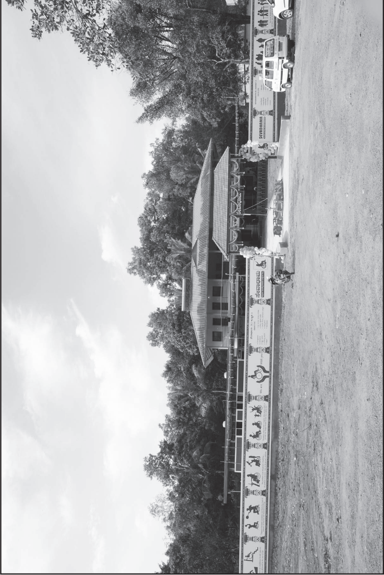
ಸೇವಾಧಾಮ ಸೌತಡ್ಡ, ಕೊಕ್ಕಡ