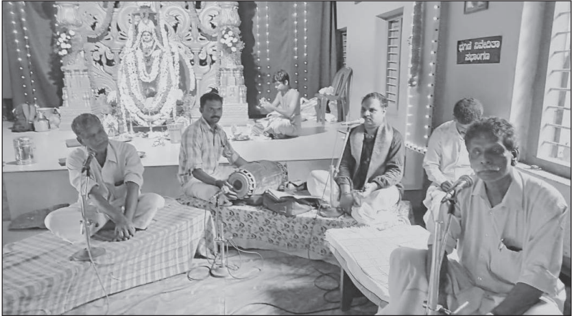
ಕನ್ನಡಿ ಶಾಲೆಯಲ್ಲಿ ಯಕ್ಷಗಾನ ತಾಳಮದ್ದಳೆ