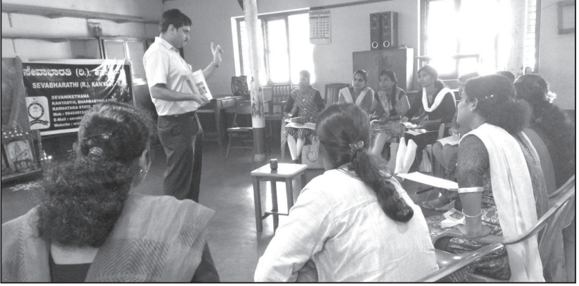
ವೇಣೂರು ವಲಯದ ಬಾಲಭಾರತಿ ಶಿಕ್ಷಕಿಯರಿಗೆ 2ನೇ ಅಭ್ಯಾಸವರ್ಗ