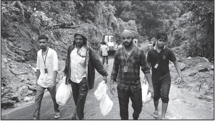
ಚಾರ್ಮಡಿ ಗುಡ್ಡ ಕುಸಿತವಾದ ಸಂದರ್ಭದಲ್ಲಿ ಪ್ರಯಾಣಿಕರಿಗೆ ನೆರವು