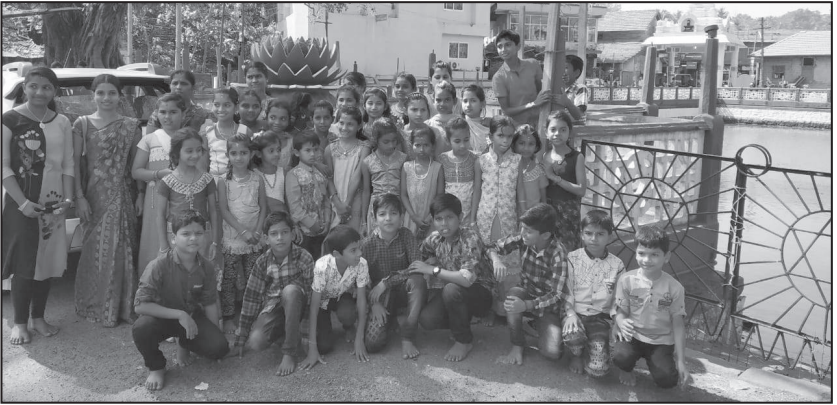
ನರಿಯ ಬಾಲಭಾರತಿ ಕೇಂದ್ರದಿಂದ ಸುತ್ತೂರಿಗೆ ಶೈಕ್ಷಣಿಕ ಪ್ರವಾಸ