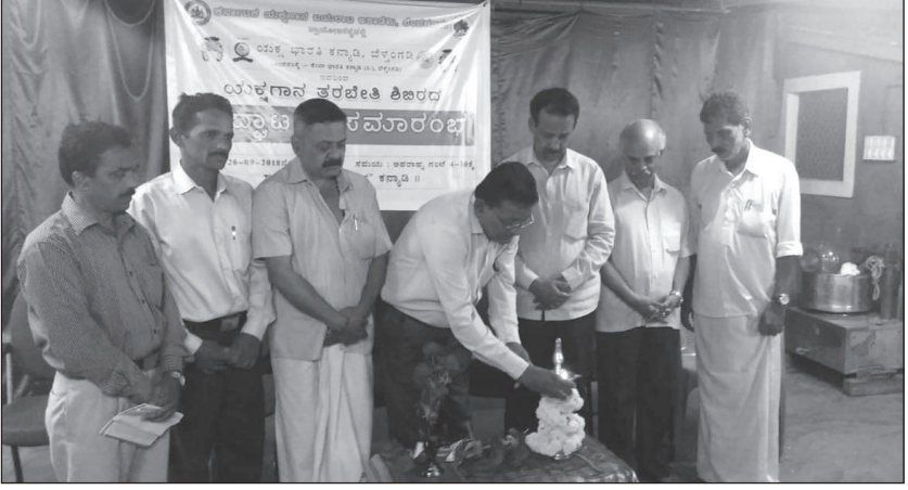
ಸೇವಾನಿಕೇತನದಲ್ಲಿ ನಾಟ್ಯ ತರಬೇತಿ ಶಿಬಿರ ಉದ್ಘಾಟನಾ ಸಮಾರಂಭ