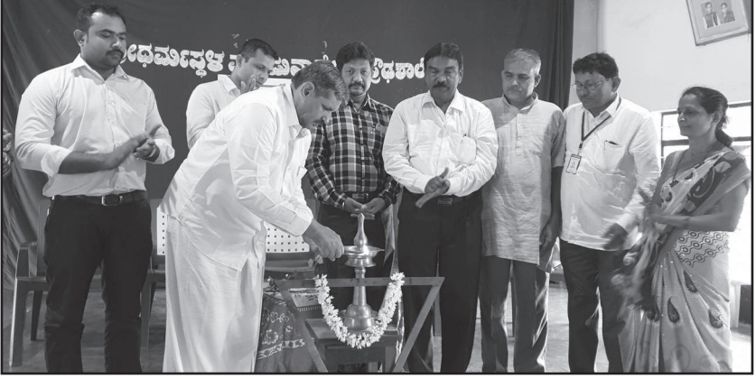
ಬೆಳಾಲು ಎಸ್.ಡಿ.ಎಮ್. ಪ್ರೌಢಶಾಲೆಯಲ್ಲಿ ನಡೆದ ರಕ್ತದಾನ ಶಿಬಿರ