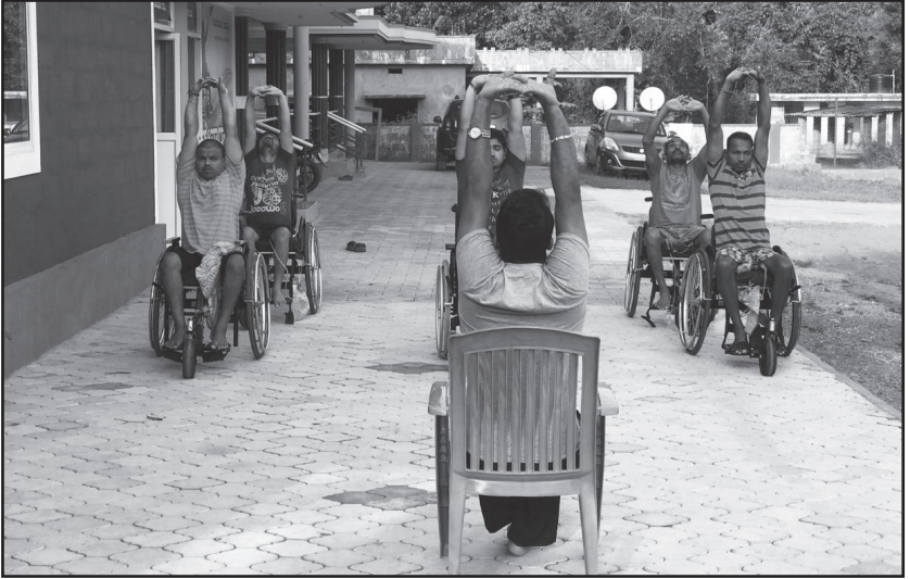
ಸೇವಾಧಾಮದ ನಿವಾಸಿಗಳಿಂದ ಯೋಗಾಭ್ಯಾಸ