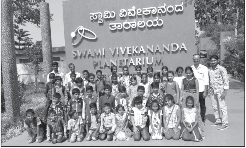
ಮೂಡುಕೋಡಿ ಬಾಲಭಾರತಿ ಕೇಂದ್ರದಿಂದ ಪಿಲಿಕುಳಕ್ಕೆ ಶೈಕ್ಷಣಿಕ ಪ್ರವಾಸ