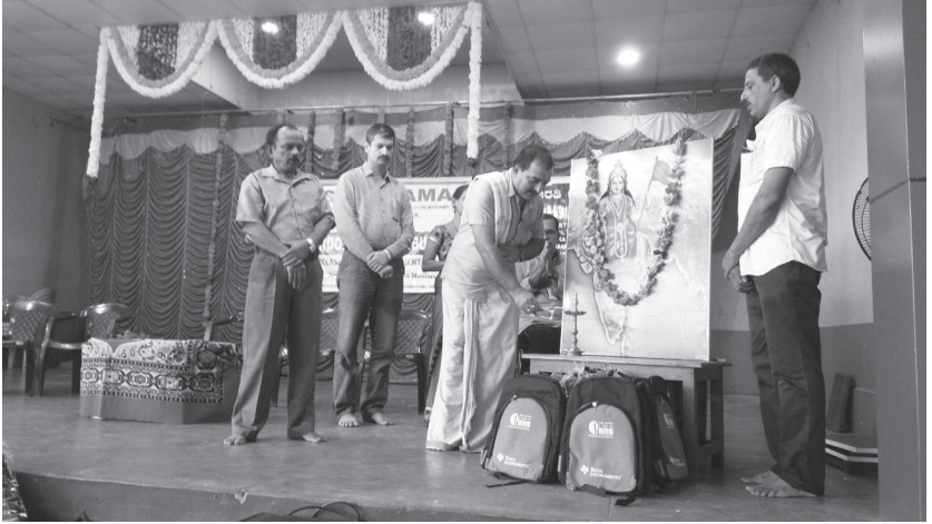
ಉಜಿರೆ ರಾಮಕೃಷ್ಣ ಸಭಾ ಮಂಟಪದಲ್ಲಿ ನಡೆದ ಸ್ಕೂಲ್ ಕಿಟ್ ವಿತರಣೆ