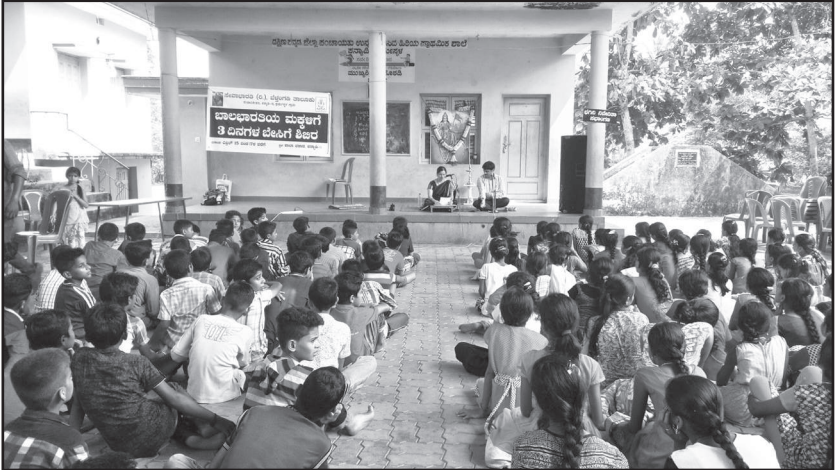
ಕನ್ಯಾಡಿ ಶಾಲೆಯಲ್ಲಿ ನಡೆದ ಬಾಲಭಾರತಿ ಬೇಸಿಗೆ ಶಿಬಿರ