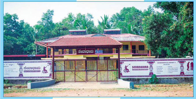
ಬೆನ್ನುಮೂಳೆ ಮುರಿತಕ್ಕೊಳಗಾದವರ ಪುನಶ್ಚೇತನ ಕೇಂದ್ರ, ಸೌತಡ್ಡ, ಕೊಕ್ಕಡ

600 ಮೌಲ್ಯದ 50 ಮಂದಿ ಉಡುಪಿ ಜಿಲ್ಲೆಯಲ್ಲಿರುವ ದಿವ್ಯಾಂಗರಿಗೆ 1000 ಮೌಲ್ಯದ ದಿನಸಿ ಕಿಟ್ ಹಾಗೂ ದಕ್ಷಿಣ ಕನ್ನಡ ಜಿಲ್ಲೆಯಲ್ಲಿರುವ 130 ಮಂದಿಗೆ ದಿನಸಿ ಕಿಟ್ ಹಾಗೂ ಮೆಡಿಕಲ್ ಕಿಟ್‌ಗಳು ಲಭ್ಯವಾಗಿದ್ದು ಅದನ್ನು ವನವನಗೆ ತಲುಪಿಸಲು ಪ್ರಾರಂಭಿಸಲಾಯಿತು. ಎರಡು ಬೊಲೆರೋ ವಾಹನಗಳಲ್ಲಿ ಸೇವಾಧಾಮದ ನಿರ್ದೇಶಕರಾದ ವಿಜಯ ಕೊಡವೂರು ಮತ್ತು ವಿಷ್ಣು ಭಟ್ ಹಾಗೂ ಸಿಬ್ಬಂದಿಗಳು ಒಂದೇ ದಿನ ಉಡುಪಿ ಜಿಲ್ಲೆಯ 36 ಮಂದಿಗೆ ತಲುಪಿಸಿರುವುದು ಉಲ್ಲೇಖನೀಯ ಸಂಗತಿ. ಒಟ್ಟು 183 ಫಲಾನುಭವಿಗಳಿಗೆ ರೂ. 1,63,000/- ಮೌಲ್ಯದ ಕಿಟ್‌ಗಳನ್ನು ಒದಗಿಸಲಾಯಿತು. ಉಡುಪಿಯ ಧಾನ್ಯಲಕ್ಷ್ಮೀ ರೈಸ್‌ಮಿಲ್‌ನ ಮಧ್ಯ ಮೂರ್ತಿಯವರ ಆವರಣದಲ್ಲಿ ನಡೆದ ಸರಳ ಸಮಾರಂಭದಲ್ಲಿ ಸಾಂಕೇತಿಕವಾಗಿ ಬಿತ್ತರಿಸುವ ಮೂಲಕ ವಿತರಣಾ ಕಾರ್ಯಕ್ರಮಕ್ಕೆ ಚಾಲನೆ ನೀಡಲಾಯಿತು. ಡಿಯರ್ ಲೈಫ್ ಕಂಪನಿಯ ಸಿ.ಎಂ.ಡಿ. ಪ್ರಮೋದ್ ಕುಮಾರ್‌ರವರಿಗೆ ಅಭಿನಂದನೆಗಳನ್ನು ತಿಳಿಸಲಾಯಿತು. ಈ ಸರಳ ಸಮಾರಂಭದಲ್ಲಿ ಸೇವಾಧಾಮದ ನಿರ್ದೇಶಕರಾದ ಕೆ. ವಿಜಯ ಕೊಡವೂರು, ಡಿ.ಎನ್.ಎ.ಯ. ಮ್ಯಾನೇಜರ್ ರೂಪಲಕ್ಷ್ಮಿ ಕೊಡವೂರಿನ ಕಾರ್ಯಕರ್ತರಾದ ವಿಷ್ಣು ಭಟ್, ಸಕ್ಷಮ ಉಡುಪಿ ಜಿಲ್ಲೆ ಇದರ ಅಧ್ಯಕ್ಷರಾದ ಲತಾ ಭಟ್ ಮತ್ತು ಸ್ವಯಂಸೇವಕರು ಹಾಗೂ ಸೇವಾಭಾರತಿಯ ಸಿಬ್ಬಂದಿಗಳು ಉಪಸ್ಥಿತರಿದ್ದರು.