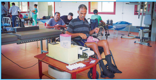
ಜೀವನೋಪಾಯಕ್ಕಾಗಿ ಸ್ವ-ಉದ್ಯೋಗ ಯೋಜನೆ