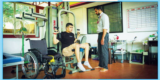
ಪುನಶ್ಚೇತನ ಕೇಂದ್ರದಲ್ಲಿ ಸನಿವಾಸಿಗಳಿಗೆ ಜಿಮ್ ತರಬೇತಿ

ಸೇವಾಧಾಮದ ವಾರ್ಷಿಕ ನಿರ್ವಹಣೆಗಾಗಿ ರೂ. 48 ಲಕ್ಷವನ್ನು ಹೊಂದಿಸಬೇಕಾಗಿದೆ.