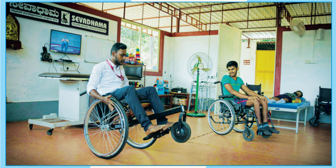
ಗಾಲಿ ಕುರ್ಚಿ ಕೌಶಲ್ಯ ತರಬೇತಿ