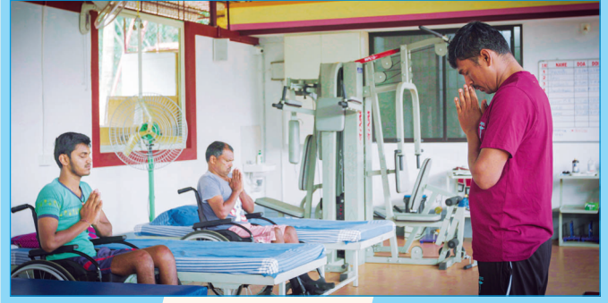
ಪುನಶ್ಚೇತನ ಕೇಂದ್ರದಲ್ಲಿ ಸನಿವಾಸಿಗಳಿಗೆ ಯೋಗ ಹಾಗೂ ಪ್ರಾಣಾಯಾಮ ತರಬೇತಿ