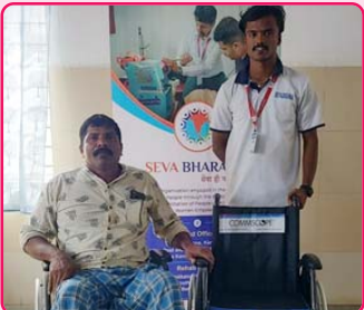
ಶ್ರೀ ಮಧುಕೇಶ್ವರ್, ಎಲ್ಲಾಪುರ