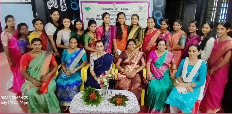
DIGAR GRAPHICS July 2024 4:00 pm