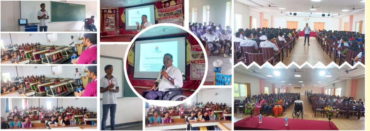
ಬಿ.ಜಿ.ಎಸ್ ಕಾಲೇಜು, ಶೃಂಗೇರಿ