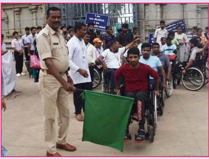
ಶ್ರೀಶ್ರೀ ಜಗದ್ಗುರು ಶಂಕರಾಚಾರ್ಯ ಮಹಾಸಂಸ್ಥಾನ ದಕ್ಷಿಣಾಮ್ನಯ ಶ್ರೀ ಶಾರದಾಪೀಠ ಶೃಂಗೇರಿ ಇದರ ಆಶ್ರಯದಲ್ಲಿ ಶ್ರೀ ಅಭಿನವ ವಿದ್ಯಾತೀರ್ಥ

ಮಲ್ವಿಷ್ಟಪಾಲಿಟಿ ಆಸ್ಪತ್ರೆ, ಶೃಂಗೇರಿ ಸೇವಾಭಾರತಿ ಸೇವಾಧಾಮ ಚಿಕ್ಕಮಗಳೂರು ಜಿಲ್ಲೆ ಇವುಗಳ ಸಹಯೋಗದಲ್ಲಿ 24ನೇ ಬೆನ್ನುಹುರಿ ಅಪಘಾತಕ್ಕೊಳಗಾದವರಿಗಾಗಿ ವಸತಿಯುತ ಉಚಿತ ಶಿಬಿರದಲ್ಲಿ ಮೇ 24, 2024 ರಂದು ಜನಸಾಮಾನ್ಯರಿಗೆ ಬೆನ್ನುಹುರಿ ಅಪಘಾತದ ಬಗ್ಗೆ ಅರಿವು ಮೂಡಿಸಲು ಮತ್ತು ಬೆನ್ನುಹುರಿ ಅಪಘಾತಕ್ಕೊಳಗಾದ ದಿವ್ಯಾಂಗರನ್ನು ಮುಖ್ಯವಾಹಿನಿಗೆ ಕರೆತರುವ ಉದ್ದೇಶದಿಂದ ಗಾಲಿಕುರ್ಚಿ ಜಾಥಾವನ್ನು ನಡೆಸಲಾಯಿತು.