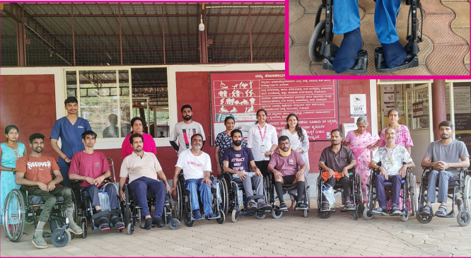
ಶ್ರೀ ಮಹಾಬಲೇಶ್ವರ, ಸಿದ್ಧಾಪುರ