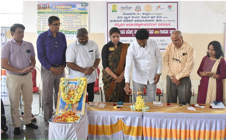
30ನೇ ಶಿಬಿರ - ತಿರಹಿ