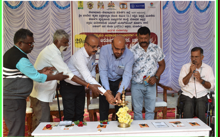
29ನೇ ಶಿಬಿರ - ಮಡಿಕೇರಿ