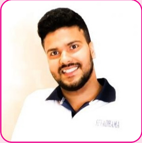
ಶ್ರೀ ಕೃಷ್ಣ ಪೂಜಾರಿ ಶಿರಸಿ