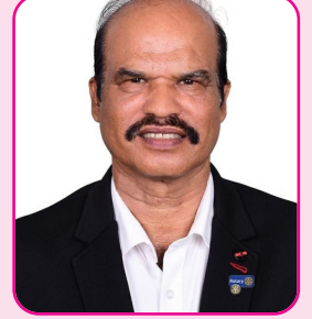
ರೋಲಿ ಪ್ರಭಾಕರನ್ ನಾಯರ್ ಸುಳ್ಯ