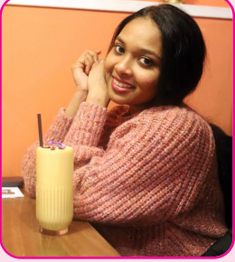
ಕು ಬಿಂದ್ಯಾ ಪುತ್ತೂರು