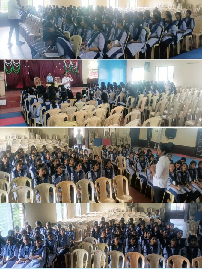
ಬಾಲಕಿಯರ ಸರ್ಕಾರಿ ಪದವಿ ಪೂರ್ವ ಕಾಲೇಜು, ಅಜ್ಜರಕಾಡು

ಉಡುಪಿಯಲ್ಲಿ ಬೆನ್ನುಹುರಿ ಅಪಘಾತಕ್ಕೊಳಗಾದವರಿಗಾಗಿ ಉಚಿತ ಆರೋಗ್ಯ ತಪಾಸಣೆ, ಜಾಗೃತಿ ಶಿಬಿರ ಹಾಗೂ ಗಾಲಿಕುರ್ಚಿ ಜಾಥಾದ ಜೊತೆಗೆ 3 ಕಾಲೇಜಿಗೆ ಭೇಟಿ ನೀಡಿ ಸುಮಾರು 201 ಮಂದಿ ವಿದ್ಯಾರ್ಥಿಗಳಿಗೆ ಬೆನ್ನುಹುರಿ ಅಪಘಾತ ಮತ್ತು ಅದರ ನಿರ್ವಹಣೆ ಬಗ್ಗೆ ಮಾಹಿತಿ ನೀಡಲಾಯಿತು.