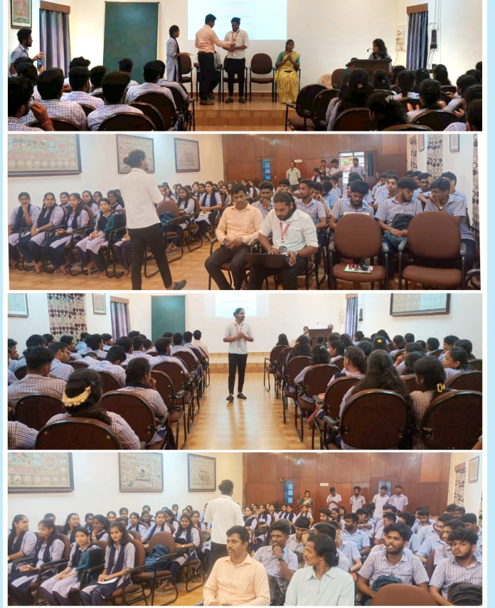
ಡಾ. ಜಿ. ಶಂಕರ್ ಸರಕಾರಿ ಮಹಿಳಾ ಪ್ರಥಮ ದರ್ಜೆ ಕಾಲೇಜು ಮತ್ತು ಸ್ನಾತಕೋತ್ತರ ಅಧ್ಯಯನ ಕೇಂದ್ರ, ಉಡುಪಿ