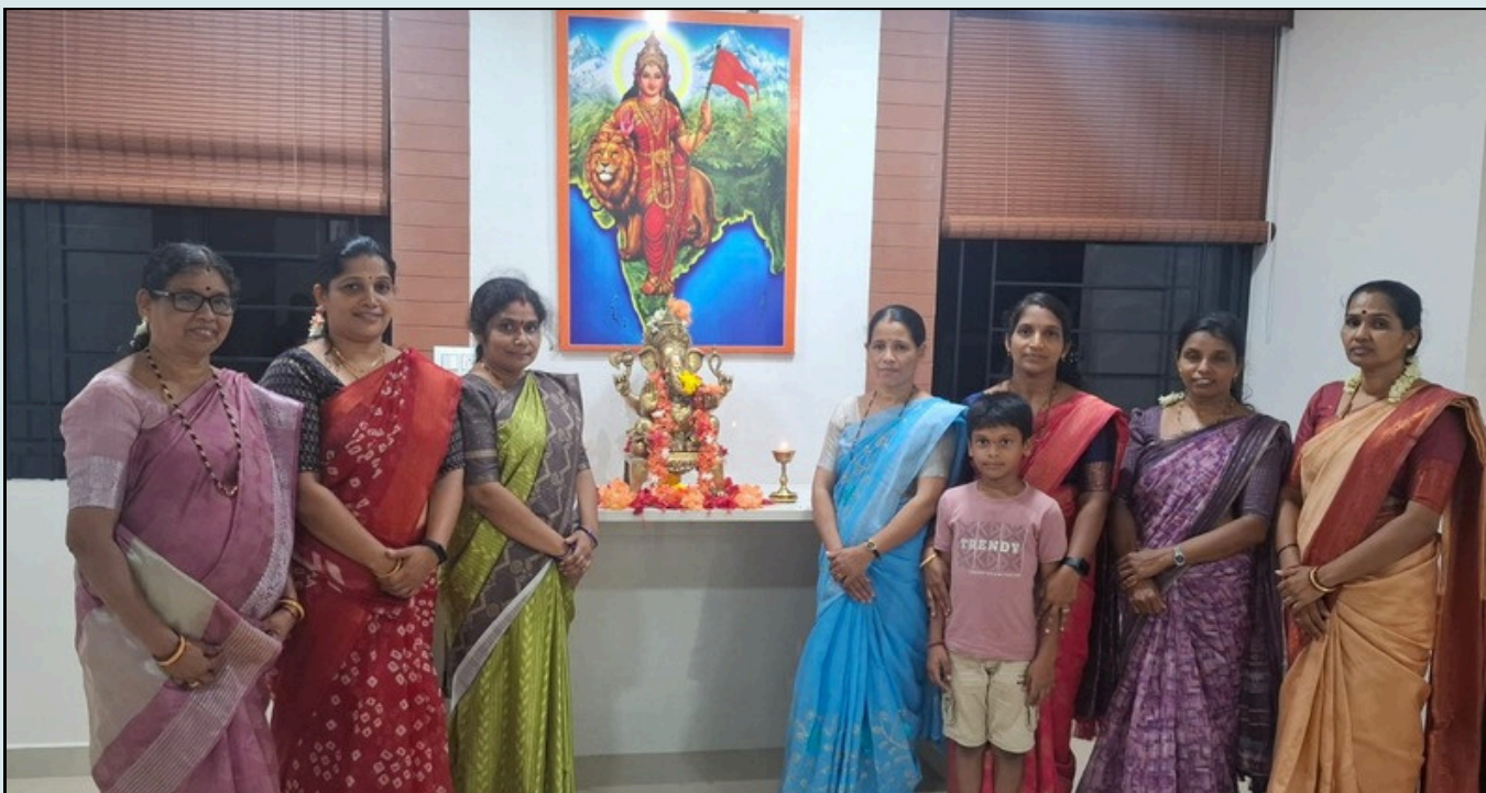
ಲಕ್ಷ್ಮೀ ಭಜನಾ ಮಂಡಳಿ, ಅಜಿತ್ ನಗರ - ಉಜಿರೆ