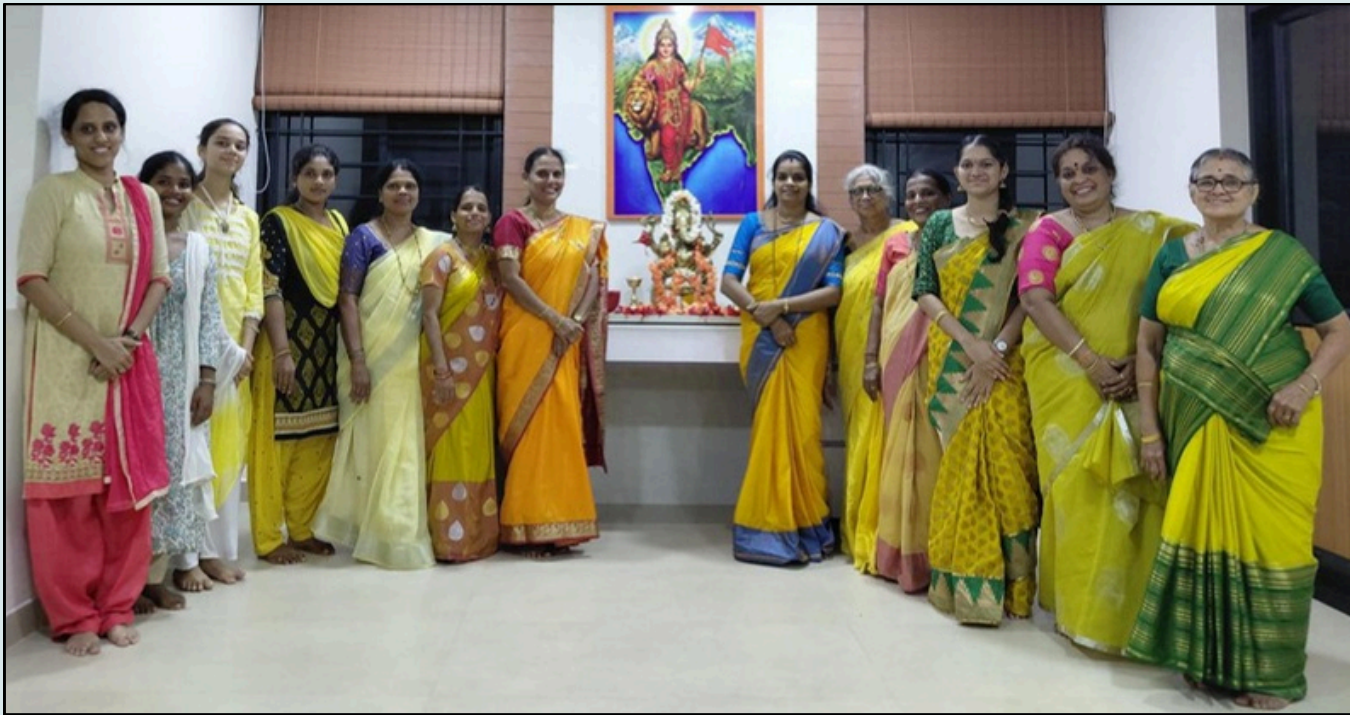
ಶ್ರೀ ಲಕ್ಷ್ಮೀ ಭಜನಾ ಮಂಡಳಿ, ಶಿವಾಜಿನಗರ - ಉಜಿರೆ