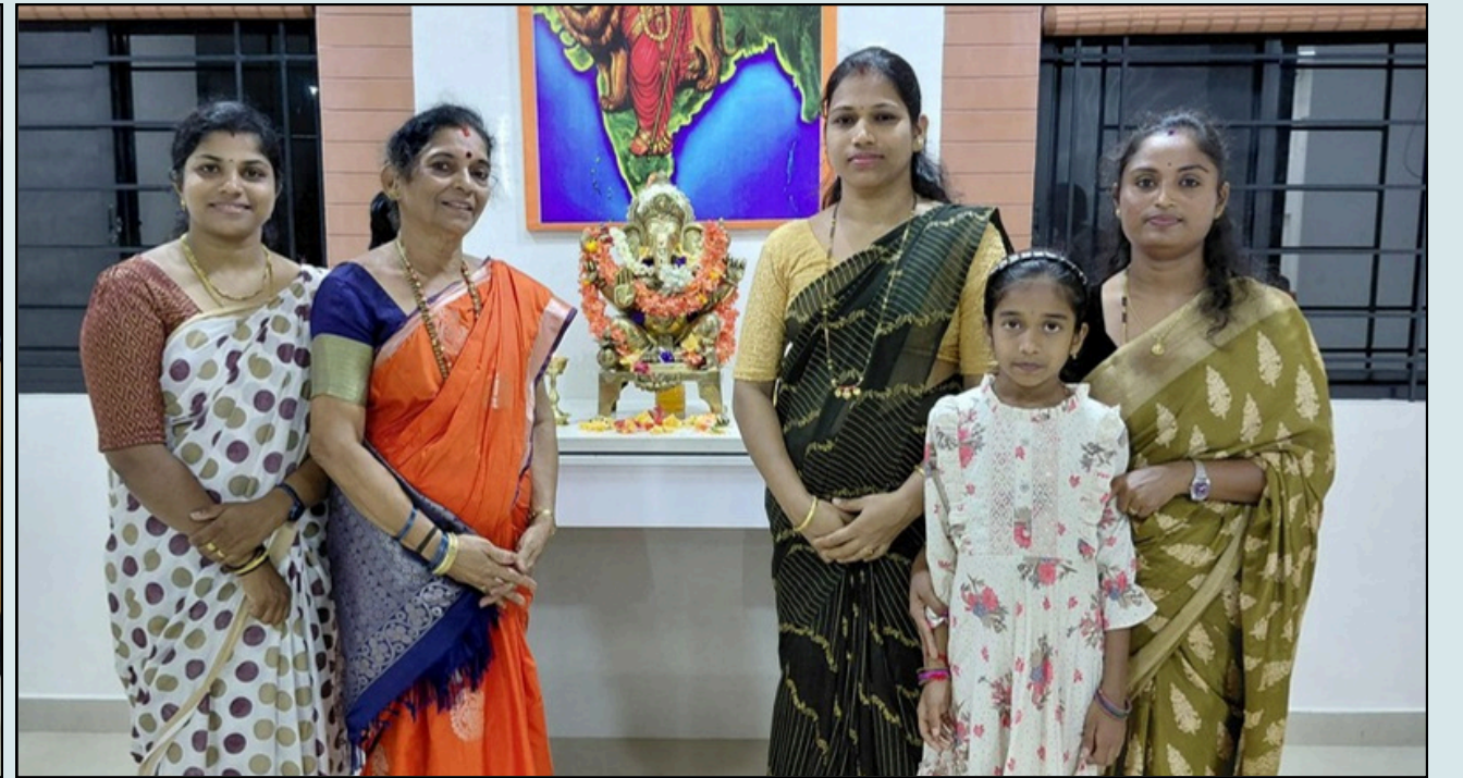
ಶ್ರೀ ಮಾರಿಕಾಂಬ ಭಜನಾ ಮಂಡಳಿ, ಉಜಿರೆ