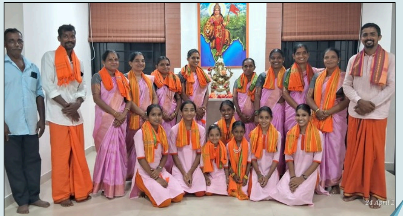
ಶ್ರೀ ಮಹಾಗಣಪತಿ ಭಜನಾ ಮಂಡಳಿ, ನಿಡ್ಲೆ